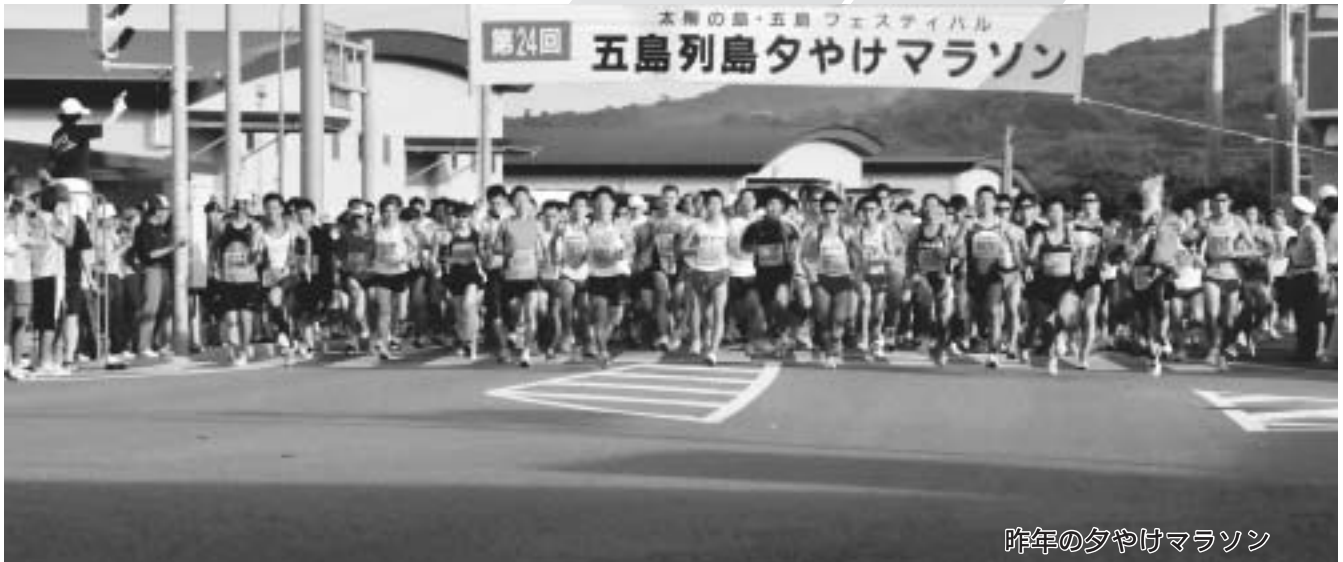
昨年の夕やけマラソン