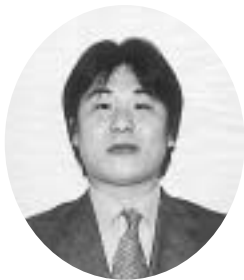
福江商工会議所青年部 第30代会長