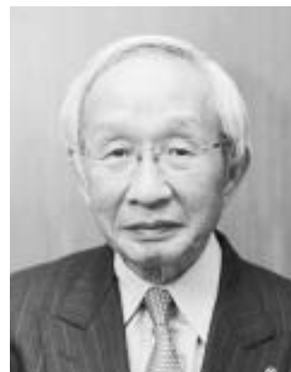
日本商工会議所 会頭 岡村 正

今日の日本は閉塞感の中にありますが、我々には将来の世代に対してよりよい経済社会を創り、襁を渡していく責務があります。長年にわたり積み残してきた課題に勇気を持って切り込み、日本経済の再生を果たしながら、50年、100年後の社会発展の基盤を再構築しなければなりません。絶え間ない「イノベーション」への挑戦により閉塞感を打ち破り、日本経済の再生と持続可能な経済社会の実現を果たすため、本年も皆様とともに前進していく決意であります。皆様の一層のご支援とご協力を心からお願い申し上げます。