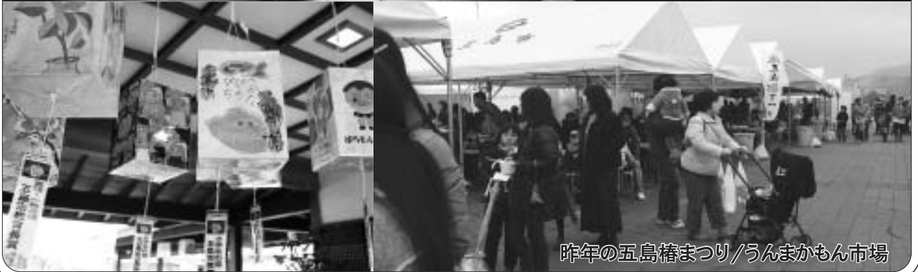
昨年 の 五島椿まつり/うんまかもん市場