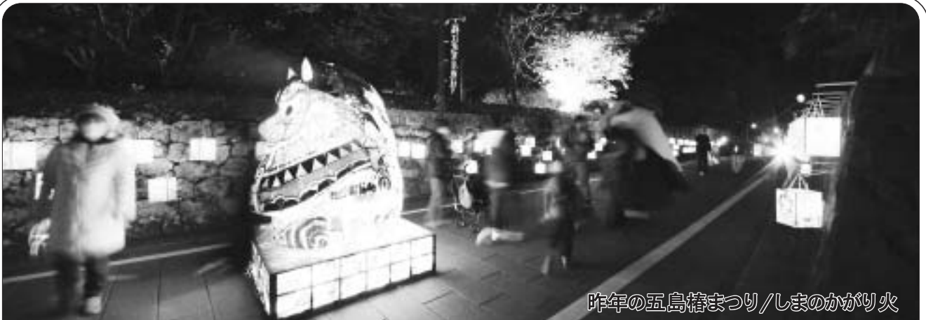
昨年 の 五島椿まつり/しまのかがり火