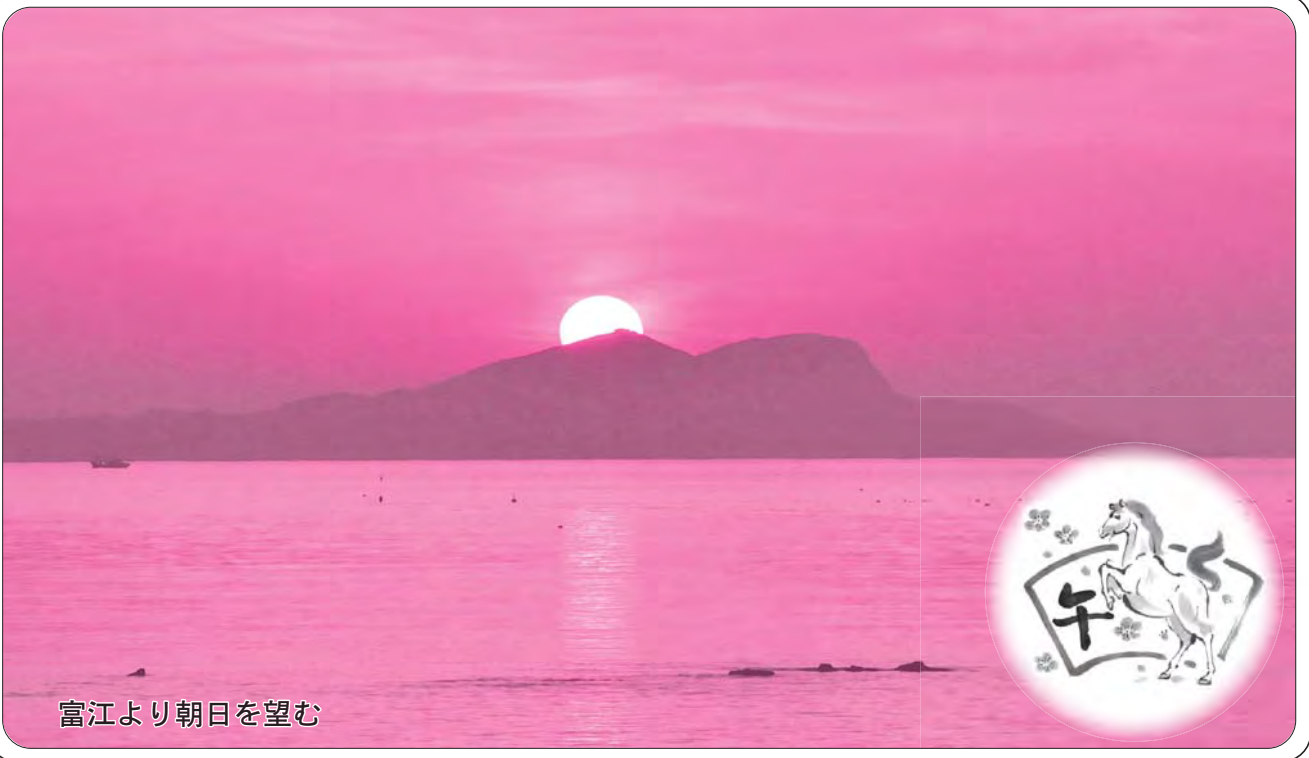
富江より朝日を望む