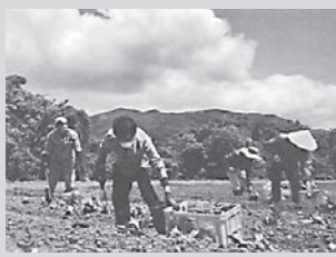
農業現場で研修中の1ターナー者ら