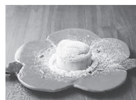
※ごと芋パンケーキ

本年9月には長崎で行われる催事に初めて参加させてもらうので、沢山の経験を通してさらにスキルアップしていきたいと思っています。