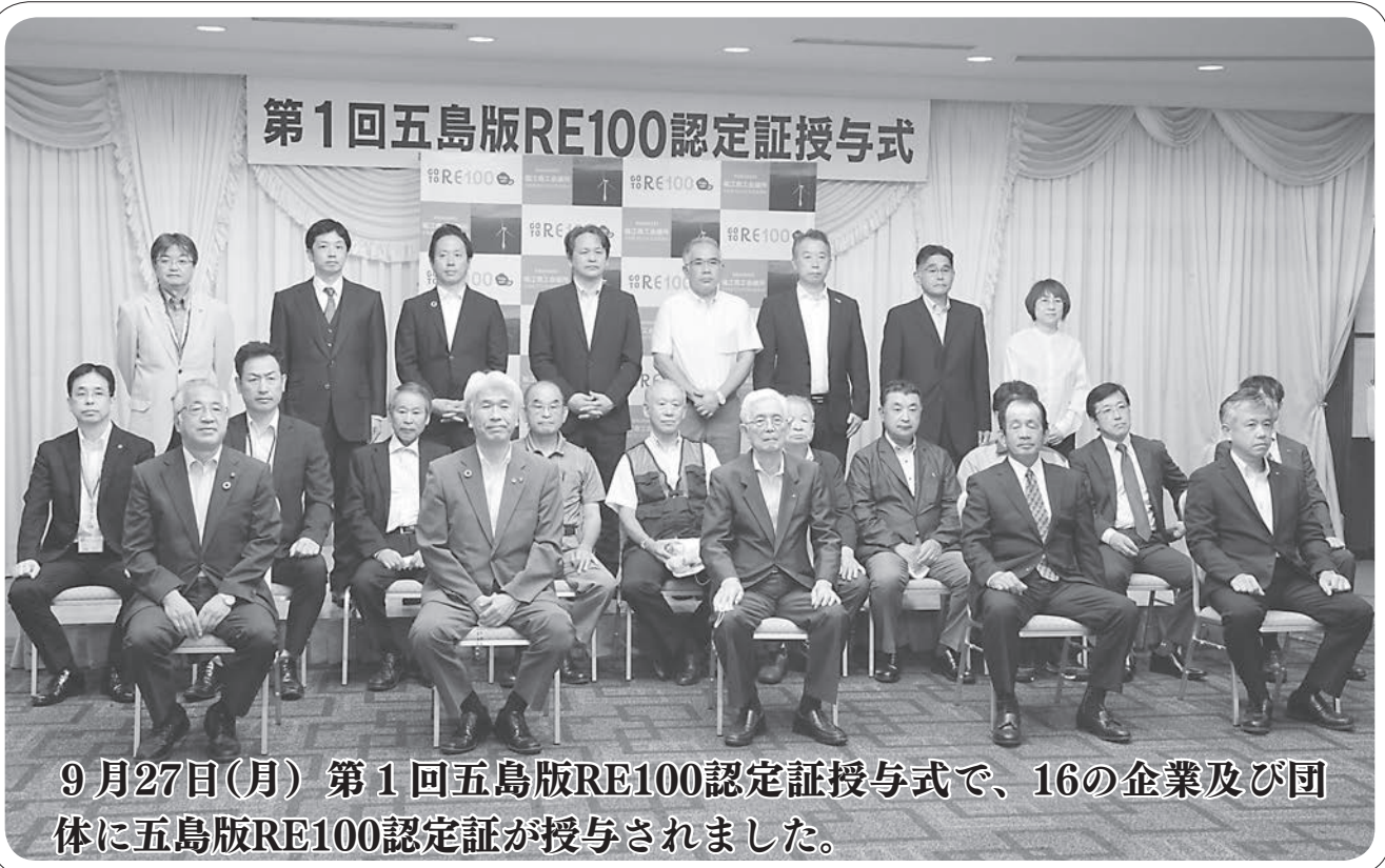
9月27日(月) 第1回五島版RE100認定証授与式で、16の企業及び団体に五島版RE100認定証が授与されました。