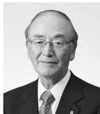
日本商工会議所 会頭 三村 明夫

さて、コロナ禍で急激に落ち込んだ経済もようやく回復基調に転じましたが、依然力強さを欠き、業種や規模により回復度合いが異なる「K字型回復」の状況が続いています。国民全体を覆う閉塞感を真に打開するためにも、昨年政府が決定した「新たな経済対策」の着実な実行はもとより、国民が日本の将来について明るい希望を抱けるような、新たな成長と発展への道筋を明確に示す必要があります。第2次岸田内閣の発足以降、政府は「新しい資本主義」を掲げ、「成長と分配の好循環」「コロナ後の新しい